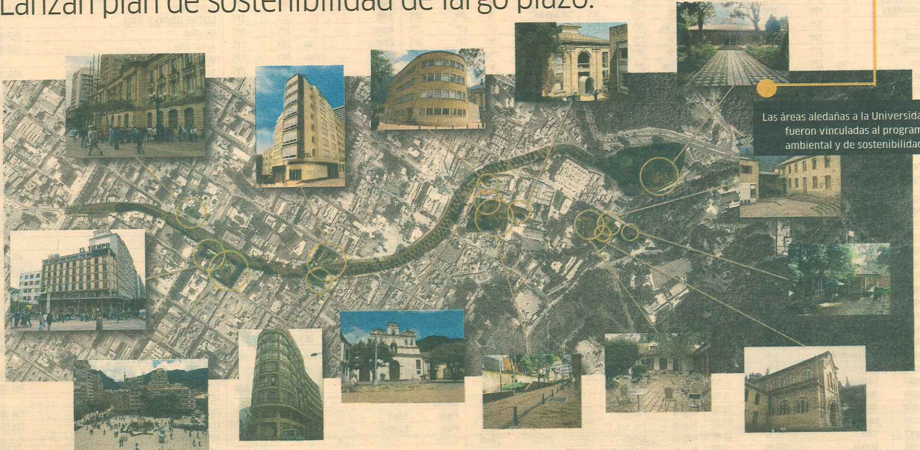
Las áreas aledañas a la Universidad fueron vinculadas al programa ambiental y de sostenibilidad.

Lanzan plan de sostenibilidad de largo plazo.