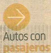
Autos con pasajeros

“Un Campus Inteligente tiene que estar integrado a la ciudad que habita, y así lo hemos entendido. La movilidad es un factor clave en la integración, por eso estamos desarrollando un parqueadero preferen-